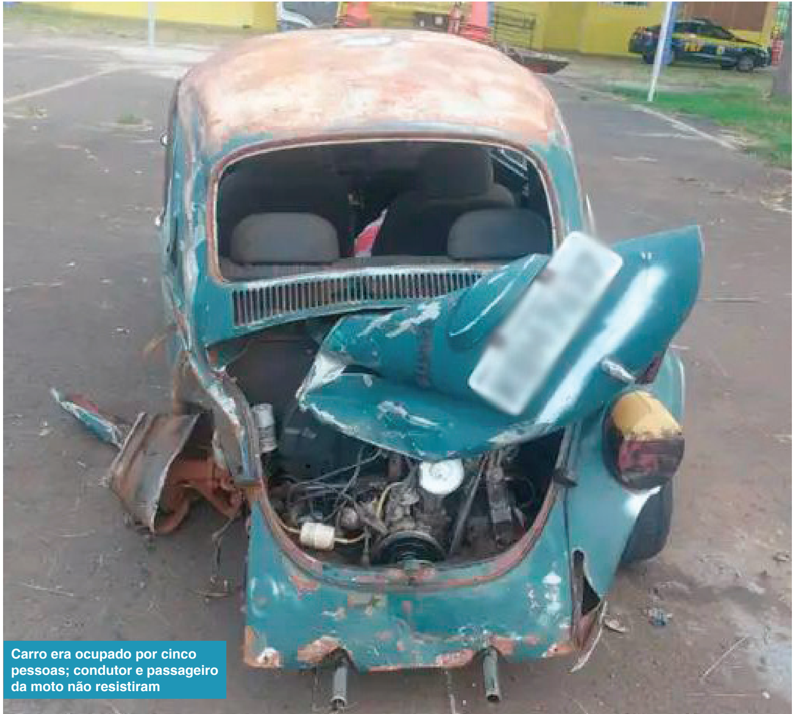
Carro era ocupado por cinco pessoas; condutor e passageiro da moto não resistiram